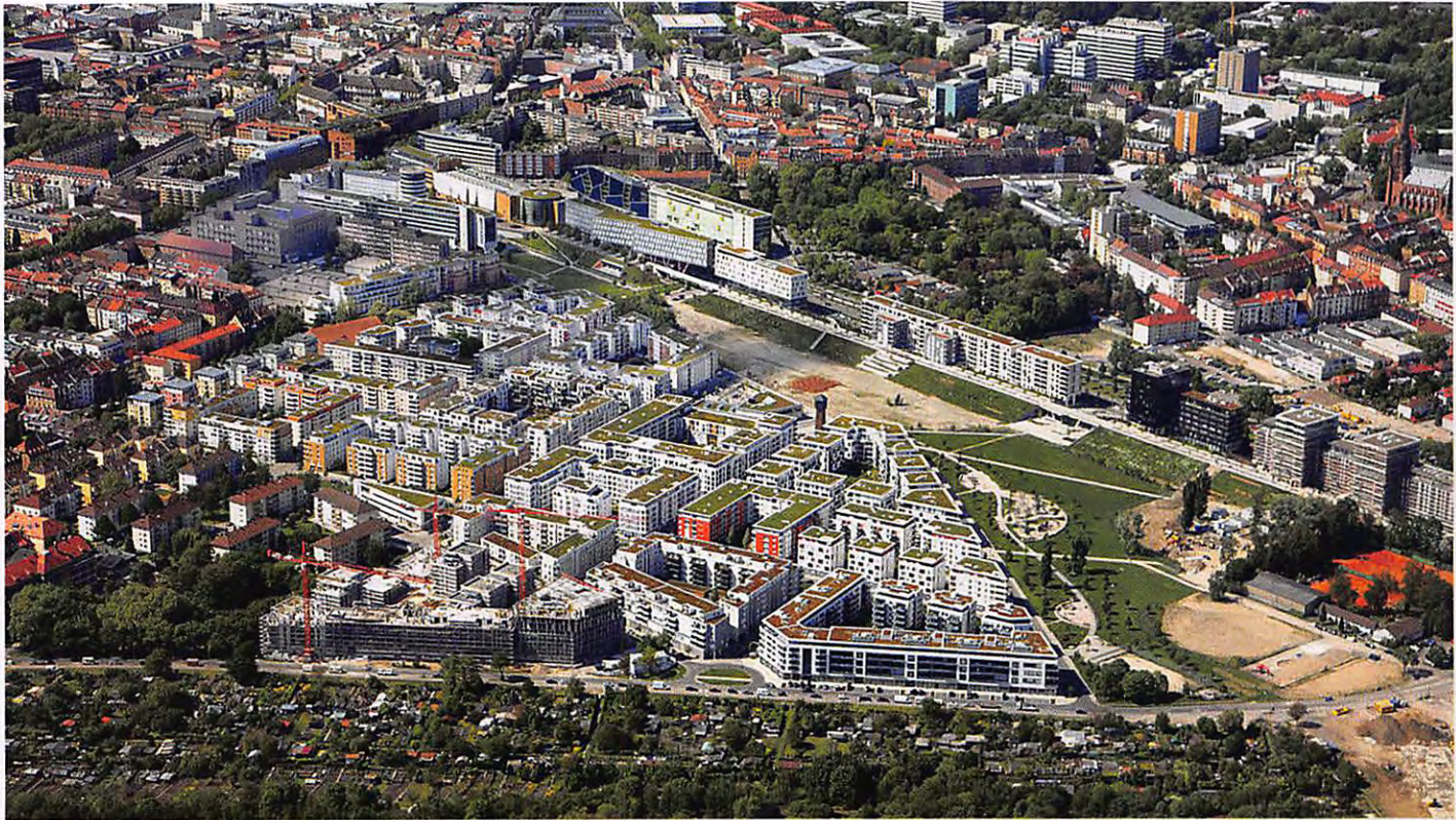
Belüftet: Das Karlsruher City Park Quartier setzte 2015 bereits viele Punkte des späteren Klimaanpassungskonzeptes der Stadt um. Deutlich sichtbar die grüne, unbebaute Kaltluftschneise, die bepflanzten Dächer und die zur Belüftung aufgebrochenen Blockränder.