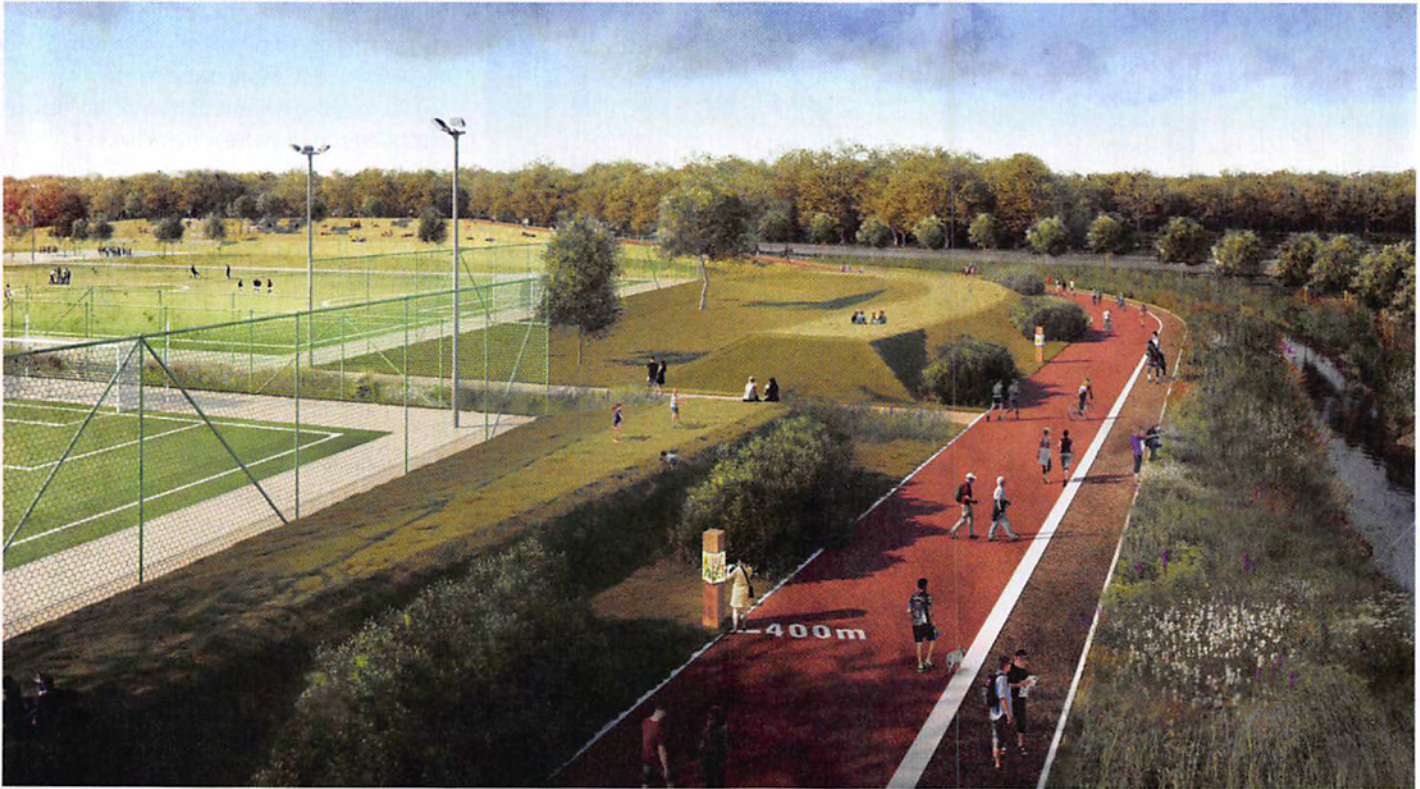
Trockengelegt: In Karlsruhe-Durlach sollen Sportflächen auf kleinen Hügeln entstehen, zwischen denen Hochwasser abfließen kann (Wettbewerbsergebnis: Dutt & Kist Landschaftsarchitekten).