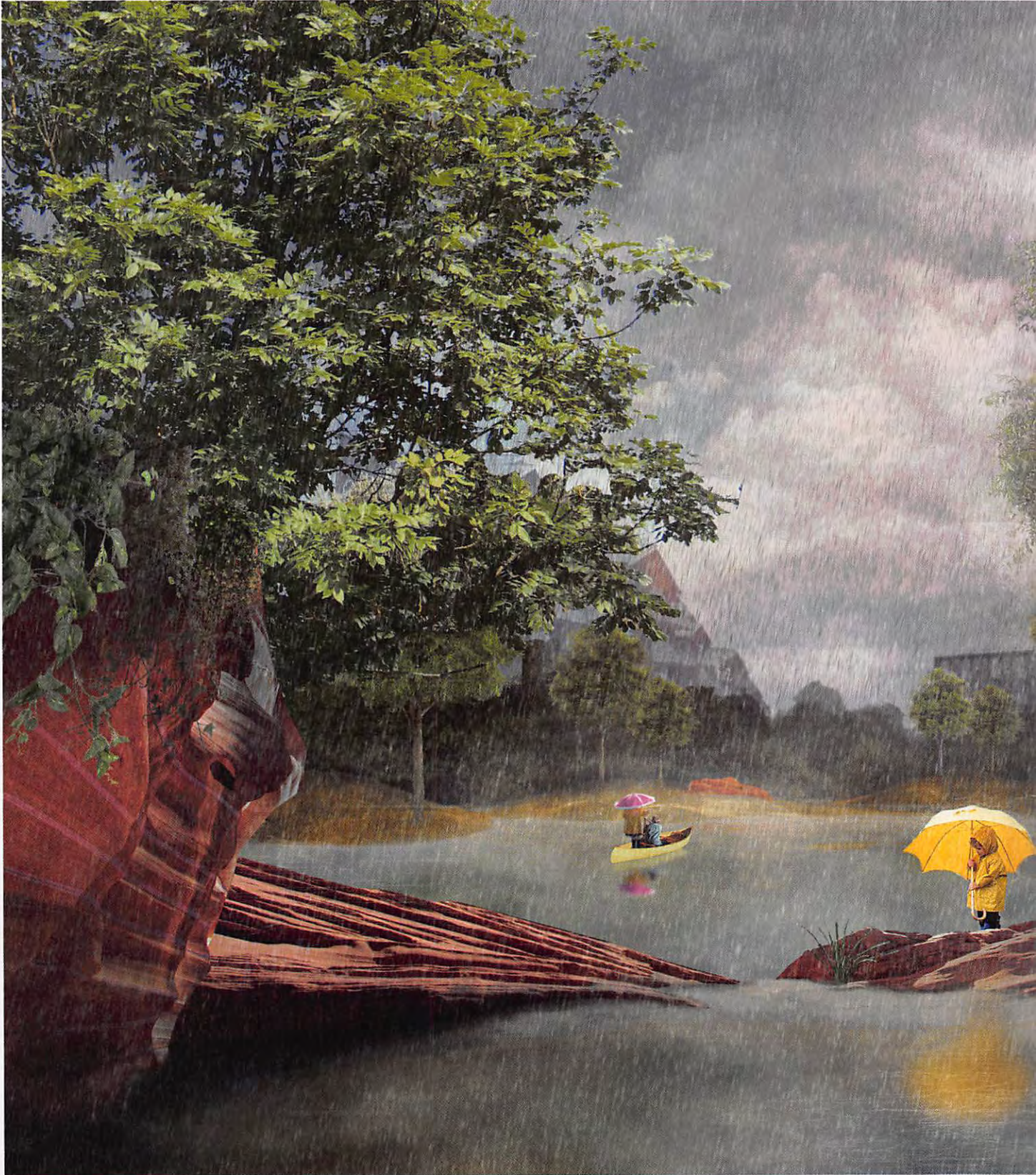
Klimaanpassung Lergravsparken, Stadtteil Amager, Kopenhagen, gruppe F Landschaftsarchitekten